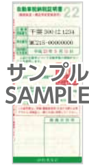
今年度の納税証明書